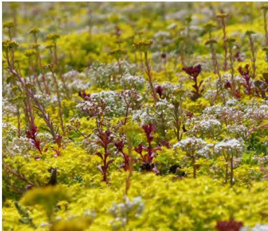
Begroeiing afhankelijk van seizoen: foto genomen in juni.

Het ECCOsedum systeem werd dusdanig ontwikkeld, rekening houdend met het klimaat waarin wij leven, zodat besproeien in droge periodes niet nodig is. Echter, in periodes waar het gedurende 14 dagen of meer niet regent, bevelen we u aan het groendak van water te voorzien. Tevens dienen meststoffen gebruikt te worden. Gebruik bij voorkeur een gecoate meststof type Osmocoat met een werkingsduur van 6 maanden (dosis: 1,5 kg/10 m 2 ). Dit type meststof kan u verkrijgen in de meeste tuincentra.