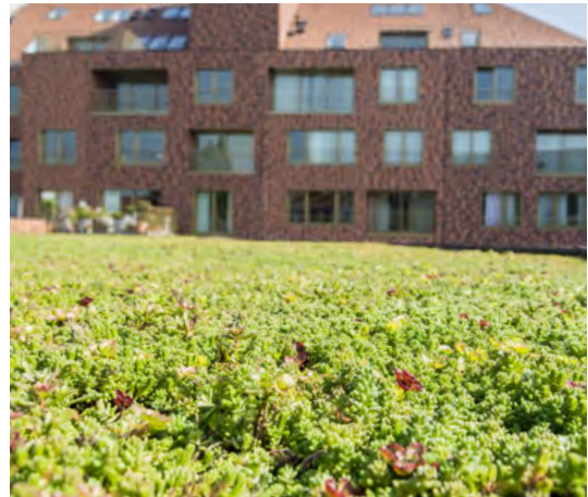
Begroeiing afhankelijk van seizoen: foto genomen eind september.