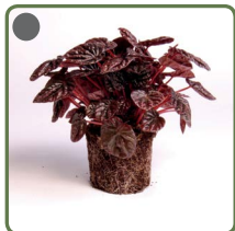
Peperomia schumi red